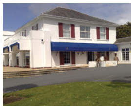
Commodore Hotel North Devon, England ASSA ABLOY brand: Mul-T-Lock

Det lokale låsesmed Almqvist & Brunskog monterede SMARTair™ Guest trådløse langskilte på Linnéa's 18 værelser. Gæsterne åbner nu værelsesdørene med et brugervenligt adgangskort. Hvis en gæst mister kortet, er der ingen sikkerhedsrisiko; hotellets bestyrer kan bare udstede et nyt. Sen check-in er meget lettere at håndtere med SMARTair™ Guest. Nyligt ankomne gæster åbner hoveddøren ved at taste en pinkode på en SMARTair™ væglæser. Gæsterne er mere tilfredse, fordi de kan ankomme, når de har lyst.